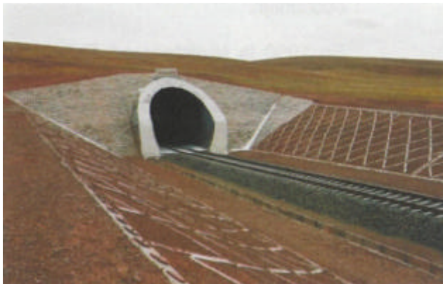
Fenghuoshan-tunelo – la plej alte situanta en la mondo. La relsurfaco estas alta je 4905 metroj super marnivelo

akumuliĝo. Oni tie renkontis ankaŭ fendakvon, subteran glacian kaj degelaĵon; la loko estas nomata „subtera kalejdoskopo”. La tunelo ekfunkciis la 26-an de septembro 2002.