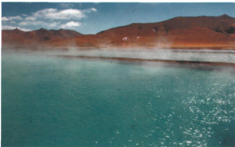
Termika fonto en Tibeto