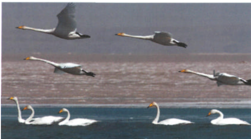
Cignoj sur Qinghai-lago, la plej granda terinterna salakva lago en Ĉinio