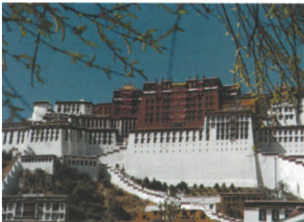
Palaco Putala en Lhasa

guron de ekspluatado, sukcesan trairon de trajno, dum fluganta neĝo kaj sur la neĝa tero. La reloj de la suda kaj la norda flankoj de la fervojo Qinghai - Tibeto kuniĝis sur la monto Tanggula , alta 5072 m. La evento ilustris la gloran historian paĝon de la ĉinaj fervoj-konstruantoj, kiuj kvitiĝis kun obstinaj montoj kaj riveroj. Post kiam la fervojo Qinghai - Tibeto transiris la monton Tanggula , ekde marto 2005, la trako sterniĝis de Nagqu al Lhasa .