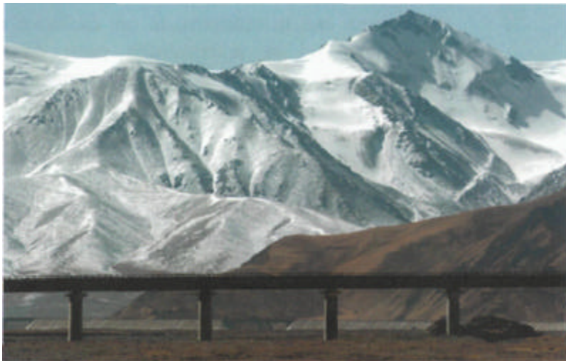
Fervojo en la Kunlun-montaro